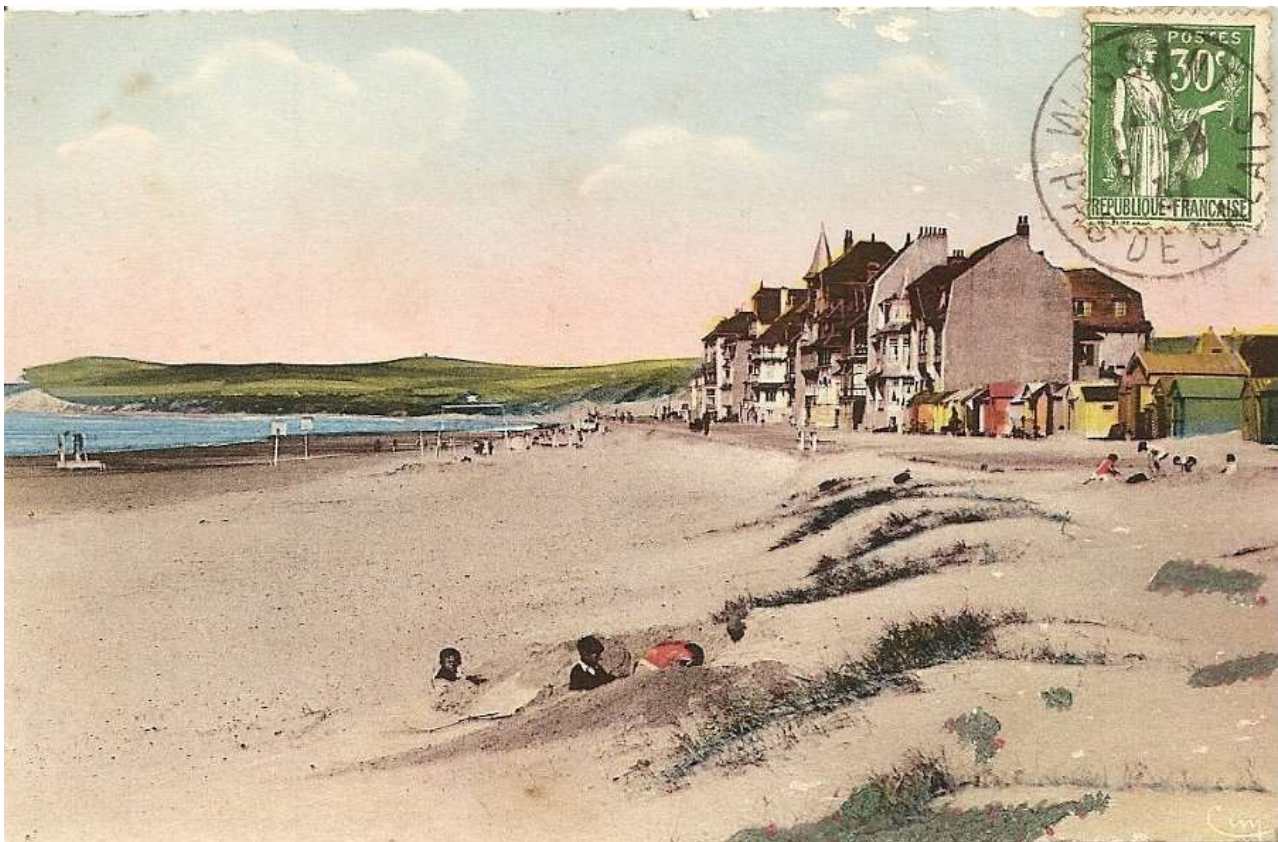
Le club est visible devant la digue sur cette carte postale d'avant-guerre.

Répartis par catégories d'âges, les cours ont lieu le matin pour une durée d'1 heure. Les plus âgés ont le privilège de débiter la journée.